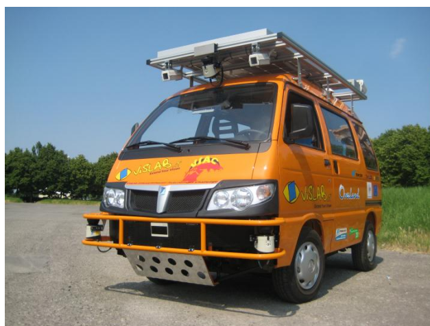
Uno dei veicoli che parteciperanno all'evento

L'evento è stato programmato dal Comitato Pro Val Parma ( www.comitatoprovalparma.it ) in collaborazione con VisLab, Comune di Corniglio, Comune di Langhirano, Consorzio del Prosciutto di Parma e Consorzio del Parmigiano-Reggiano.